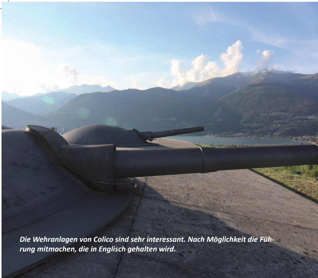
Die Wehranlagen von Colico sind sehr interessant. Nach Möglichkeit die Führung mitmachen, die in Englisch gehalten wird.

Festung von Fuentes - auf dem Hügel Monte di Montecchio gelegen - wurde Anfang des 17. Jahrhunderts vom spanischen Gouverneur des Herzogtums Mailand, Don Pedro Enriquez de Acevedo, Graf von Fuentes, erbaut. Die Überreste dieser Anlage lassen sich am nördlichen Ortsteil besichtigen. Geöffnet am Wochenende. 0341 295720.