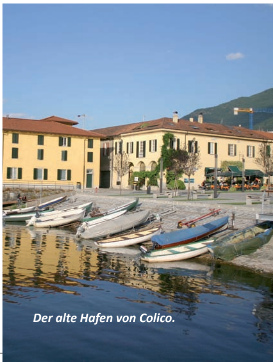
Der alte Hafen von Colico.

Ein Blick auf den Hafengebiet unterstreicht diesen Eindruck: Großzügig angelegt sind sowohl die Piazza am See als auch die Strandbereiche südlich und nördlich des Ortes mit den sich anschließenden Campingplätzen. Viele kleine Vororte (u.a. Curcio, Laghetto, Olgiasca und Villatico) erstrecken sich entlang der sanft ansteigenden Ebene, die das Fundament des Monte Legnone bilden, des höchsten Berges am Comer See. Im Industriegebiet von Colico befindet sich ein riesiges Einkaufszentrum, das man in dieser Gegend eigentlich nicht erwartet: Iperal Fuentes. Ein Zentrum der Superlative! Zwei Dutzend Einzelhandelsgeschäfte und einige Snacks tun alles dafür, dass die Gäste möglichst viel Zeit hier verbringen.