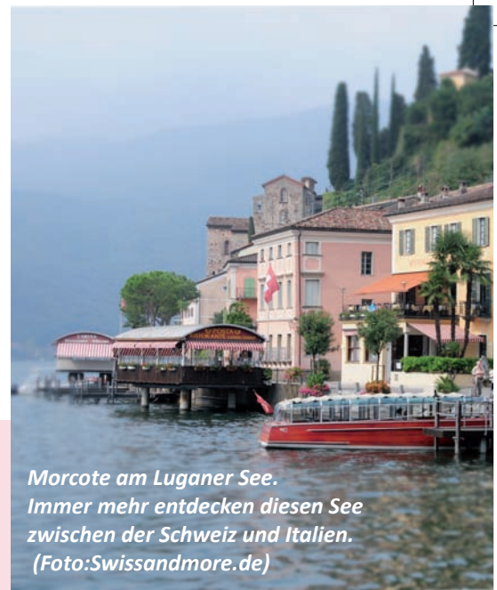
Morcote am Luganer See. Immer mehr entdecken diesen See zwischen der Schweiz und Italien.

Bitte senden Sie dieses PDF-Magazin auch an Ihre Freunde, Verwandten und andere Interessierte.