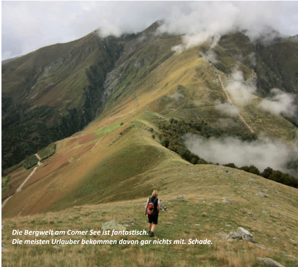
Die Bergwelt am Comer See ist fantastisch. Die meisten Urlauber bekommen davon gar nichts mit. Schade.

ge jedes der zehn Teilabschnitte ist so berechnet, dass er bequem an einem Tag zu bewältigen ist. Am Ende eines Tages steht meist die Suche nach einem geeigneten Übernachtungsplatz. Alternativ können Sie das öffentliche Nahverkehrssystem aus Bussen und Schiffen nutzen und sich wieder an Ihren Ausgangspunkt zurückbringen lassen. Der im Handel erhältliche Wanderführer (Albano Marcarini: Wandern auf der historischen Strada Regina) ist aufwendig gestaltet und kann vor Ort in einigen Tourismusbüros sowie via Internet bezogen werden (Lysis-Verlag, 14 €; www.lyasis.com). Klicken Sie auf ‚Guide Multum in Parvo‘ und wählen Sie die deutsche Ausgabe. Es gibt den Guide - für einen etwas höheren Preis - auch beim Internethändler Amazon.