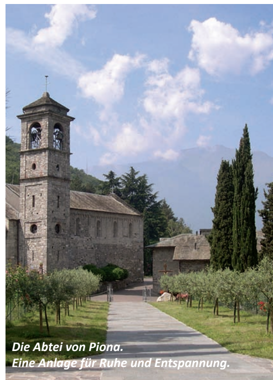
Die Abtei von Piona. Eine Anlage für Ruhe und Entspannung.

10 | 2013: Endlich hat der Tunnel auf der Höhe von Valsolda geöffnet. Die Anreise an den Comer See über Lugano geht dadurch spürbar schneller. Ab 11. Oktober!