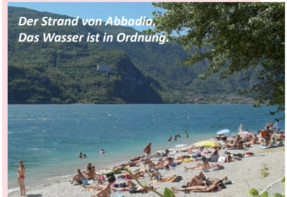
Der Strand von Abbadia. Das Wasser ist in Ordnung.

Cernobbio. Schwimmbad direkt an der Uferpromenade in der Nähe der Anlegestelle. Colico. Mehrere schöne Strandabschnitte nördlich des Hafens bis zur Mündung der Adda. Colico-Laghetto. In Laghetto südlich von Colico, am so genannten ‚kleinen See‘, befindet sich ein sehr schöner Naturstrand mit großer Liegewiese und einer Slipanlage für kleinere Boote. Im Sommer ist hier auch bis in die Abendstunden richtig was los. Parkplätze in großer Anzahl vorhanden, SnackBar im Kiosk am Ende der Bucht. Como. Am nördlichen Ortseende der Uferstraße nach Bellagio ca. 2 km folgen. Dervio. Naturbelassener großzügiger Uferstreifen an der Flussmündung. Domaso. Langgestreckter, schön angelegter Strand mit Cafés und Restaurants. Dongo. Von Gravedona bis Dongo weitgehend naturbelassener Strandabschnitt. Gera Lario/Sorico. Nördlich des Hafens befindet sich ein großzügiger Badeplatz. Lecco. Ein Freibad direkt am Ufer liegt rund 500 Meter vor der großen Brücke. Lenno. Am Ende des Hafens liegt ein kleiner, mit Sand aufgeschütteter